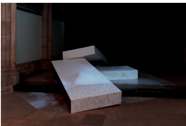
Rub the floor / clean memory- Effacer le plancher/ Essuyer la mémoire , Filmage d'effacement des textes lors de la désinstallation de one week , un texte par jour